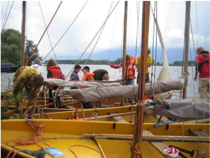
Boten optuigen met zomerkamp